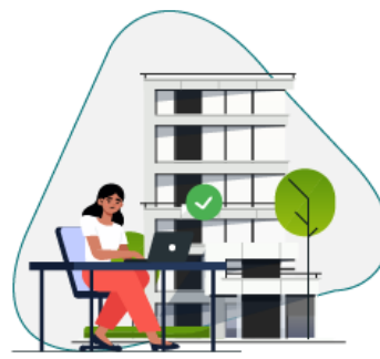
+ Instituciones de Educación Superior